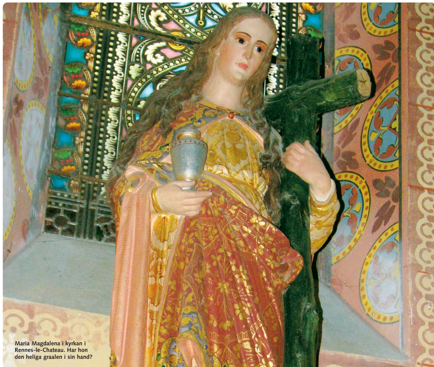
Maria Magdalena i kyrkan i Rennes-le-Chateau. Har hon den heliga graalen i sin hand?