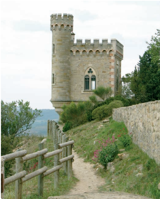
Magdala Tower, upprättat av Bérenger Saunière, med utsikt över graven.

slingrar sig vägen upp mot den lilla byn med de typiska och så vackra franska gamla stenhusen. Utsikten över det böljande landskap är sagolik.