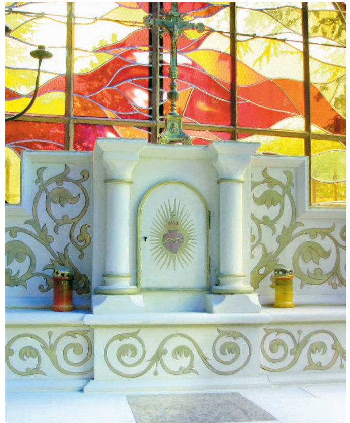
Altaret med Jesus hjärta (den heliga graalen?) i Villa Bethania i Rennes-le-Chateau.

Visste Saunière att Maria Magdalena och Jesus var ett par och hade barn? Hade han funnit sanningen om den heliga graalen? Vad det i samband med detta som han fått ta emot en stor summa pengar och renoverat och utsmyckat kyrkan, byggt Magdala Tower, kanske med utsikt över graven, och Villa Bethania? Saunière tog med sig sin hemlighet i graven