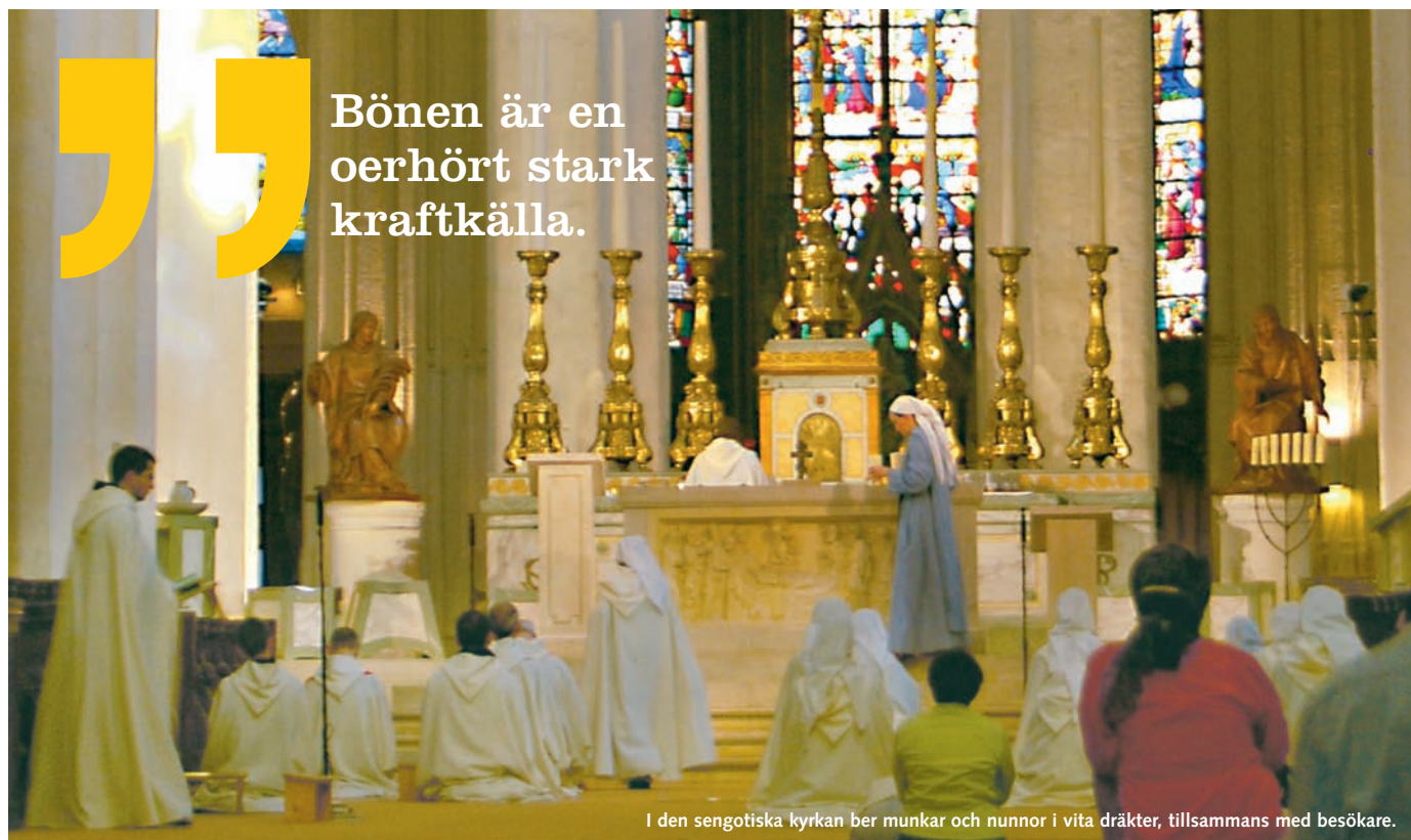
I den sengotiska kyrkan ber munkar och nunnor i vita dräkter, tillsammans med besökare.