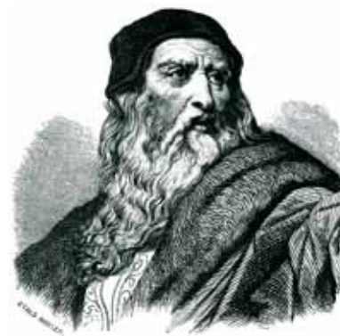
Leonardo da Vinci föddes 15 april 1452 i Anchiano nära Vinci, Toscana, Italien, och avled 67 år gammal i maj 1519 på slottet Clos Lucé i Amboise, Indre-et-Loire i Frankrike. Leonardo var en italiensk målare, arkitekt, ingenjör, uppfinnare och naturforskare.

Renässansvärlden tjänar som kuliss för Leonardos lyskraft - det var en tid när nya idéer som humanism, vetenskaplig förståelse av kosmos och vårt personliga öde kom, och man började ifrågasätta den visdom man fått från kyrkan, som ju regerade med stöd av dogmer snarare än utifrån erfarenhet. Han la grunden till många idéer och företeelser som vi tar för givna, till exempel flygplan, ubåtar, dykarklockan, helikoptrar, stridsvagnar, ångmaskinen, avancerad hydraulik, plast och kontaktlinser, liksom även camera obscura, föregångaren till den moderna kameran. Leonardos högt-