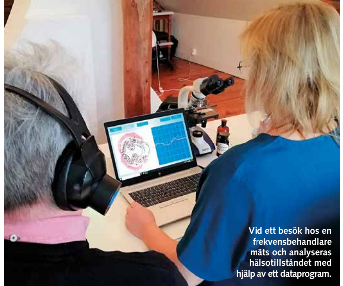
Vid ett besök hos en frekvensbehandlare mäts och analyseras hälsotillståndet med hjälp av ett dataprogram.

- Vanliga sjukdomstillstånd där människor har blivit hjälpta av frekvensbehandling är bland annat besvär och smärta i rygg, nacke och axlar, knäleds- och höftledsbesvär, huvudvärk och migrän, andningsbesvär och bihåleproblem, matsmältnings-, tarm- och magproblem,