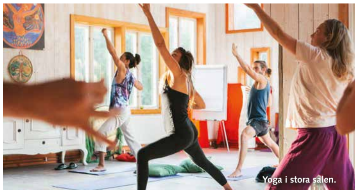
Yoga i stora salen.