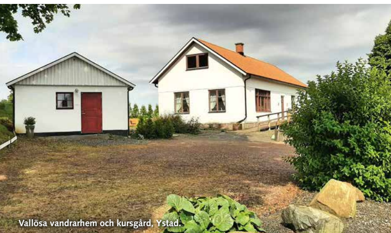
Vallösa vandrarhem och kursgård, Ystad.