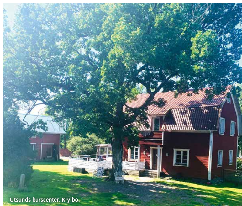
Utsunds kurscenter, Krylbo.