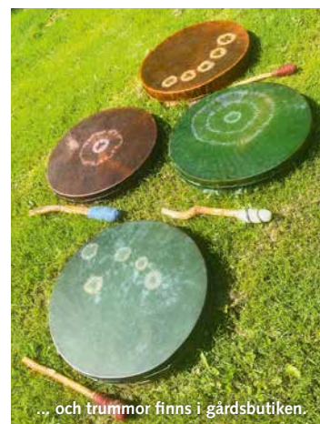
... och trummor finns i gårdsbutiken.