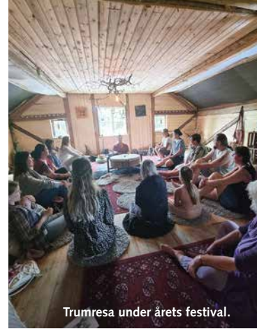
Trumresa under årets festival.