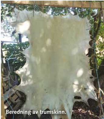
Beredning av trumskinn.