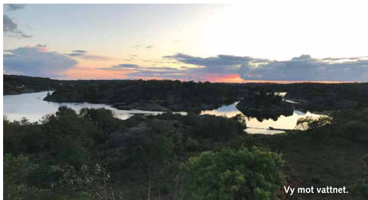
Vy mot vattnet.