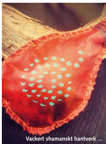
Vackert shamanskt hantverk ...