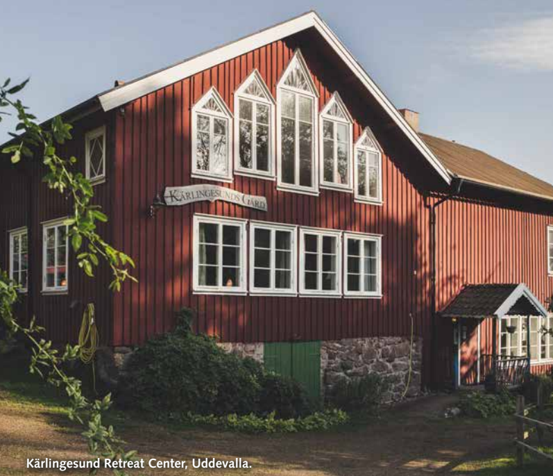
Kärlingesund Retreat Center, Uddevalla.

I kursgård- och retreatcenterspecialen tipsar vi dig som söker en plats där du kan stanna upp, lyssna inåt och utvecklas tillsammans med andra. Vi listar 57 fantastiska ställen! De flesta har verksamhet året om med event, kurser och retreatar. Många går även att hyra för den som planerar att arrangera en egen kurs eller vill samlas tillsammans med familj och vänner. I år har vi kikat lite närmare på Kärlingesund Retreat Center, Hilaria i Utsund och Vallösa vandrarhem och kursgård.