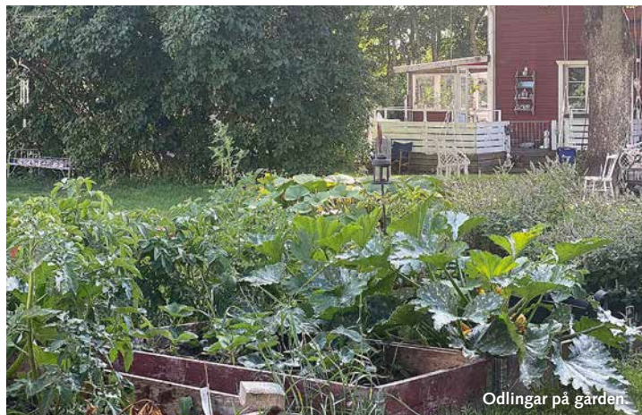
Odlingar på gården.