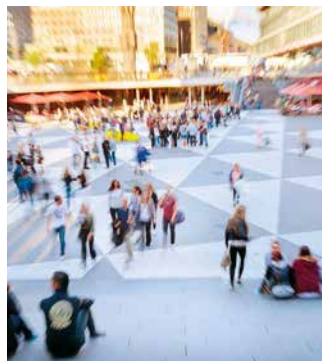
I boken finns mycket av Evas funderingar om skillnader mellan storstadsliv och livet på landet.

Många människor är identifierade med innehållet i sina tankar och tror att dess innehåll är detsamma som ens jag. Med meditation eller annan typ av uppmärksamhetsträning går det att lära sig att iaktta sina tankar. Då ser man att en stor del av